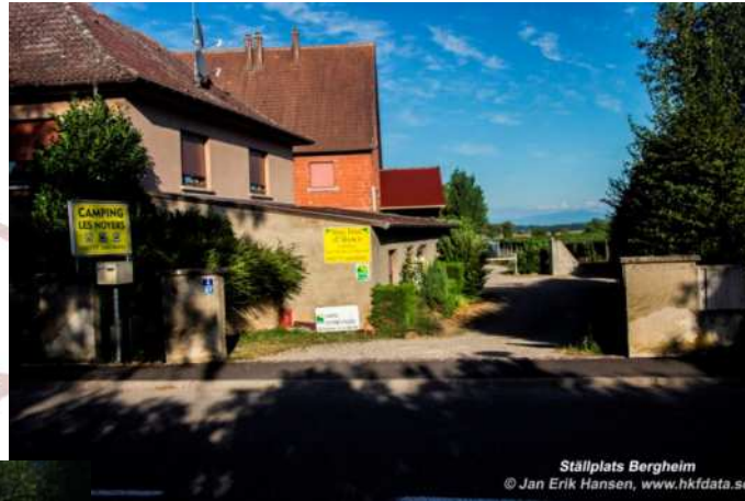
Ställplats Bergheim

Dagen efter när vi hade ätit frukost var det dags att åka vidare. Vi åkte till Alsace i Frankrike.