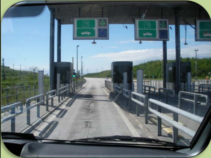
Vi åkte på bron över till Danmark