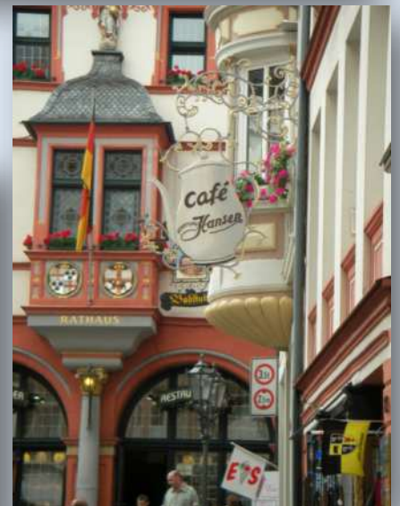
Cafe Hansen Nej det är inte mitt!!