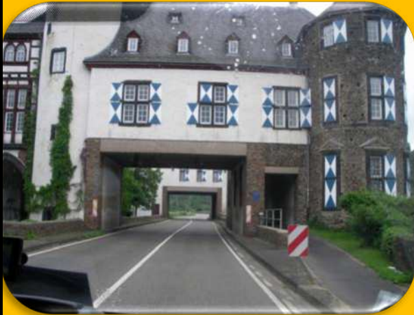
Infarten till campingen i Koblenz