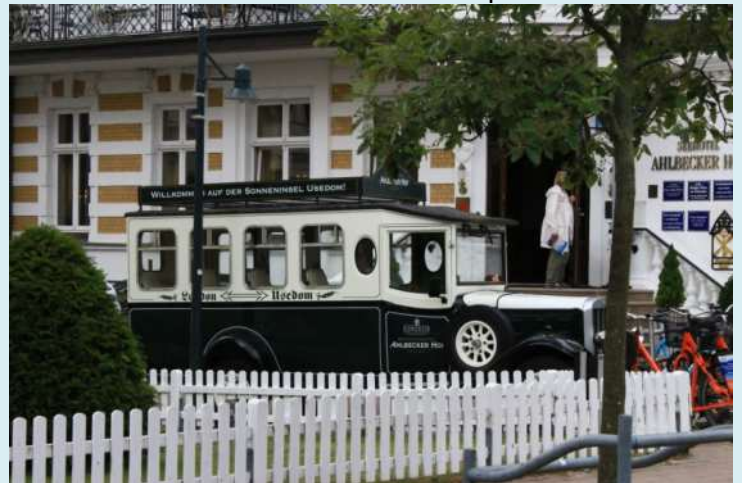
Infarten till ställplatsen i Ahlbeck