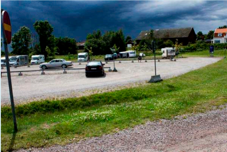
Ställplatsen Bergs slussar

Ja det var en svart himmel och det åskade rejält några mil bort . Norrköping och det området var värst drabbad