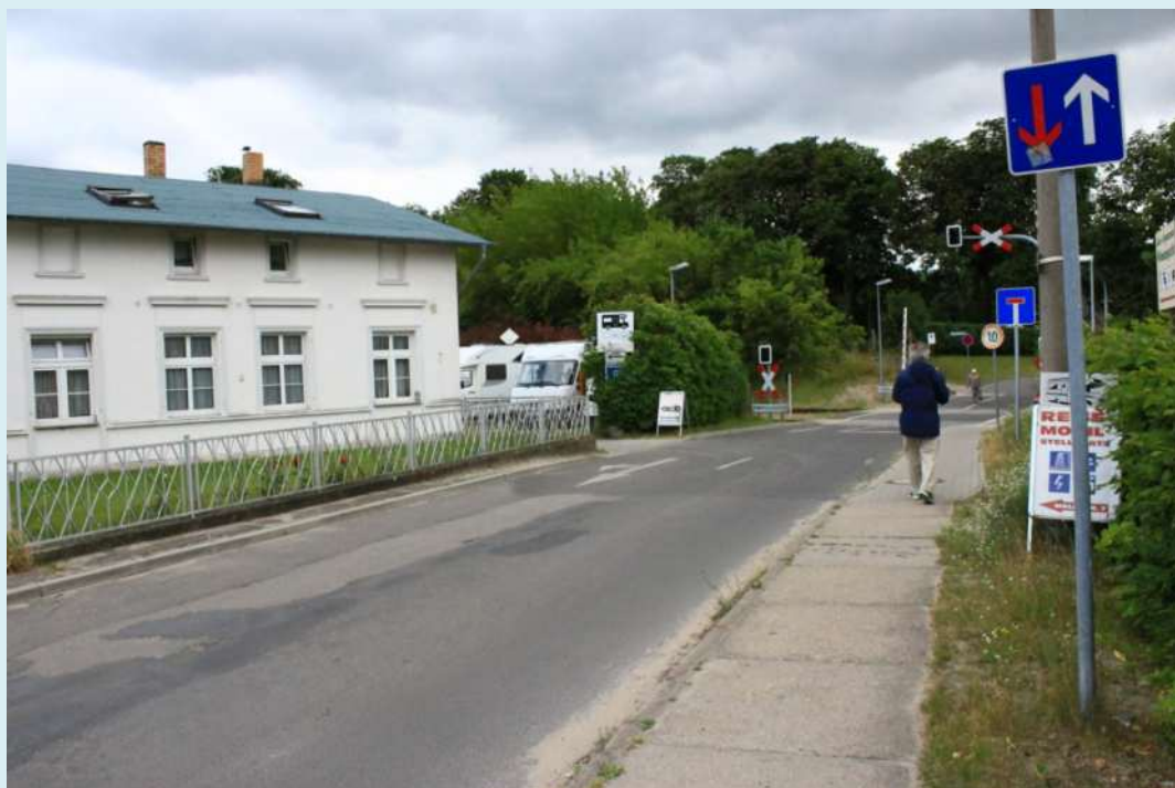
På denna ställplats mötte vi kompisar från Husbilsklubben