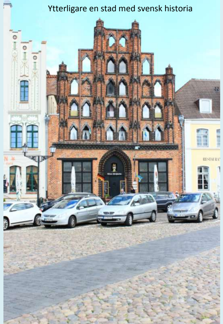
Ytterligare en stad med svensk historia

to the harbour in order to block off the harbour basin and in this way, as necessary, to deny access to ships. In front of the portal of the baroque building stand the so-called „Swedish Heads“ which during the Swedish reign marked the navigable channel into the harbour on wooden pylons.