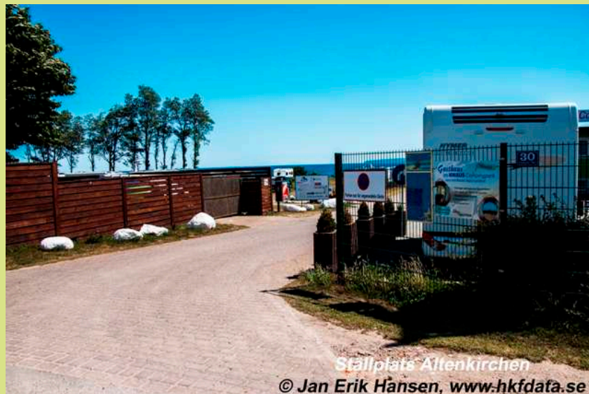
Ställplats Altenkirchen

Nu är det dags att fara mot Rügen vi tog sikte på ställplatsen Altenkirchen. Tyvärr fullt så det fick bli campingen istället. Infarten till camping och ställplats är samma.